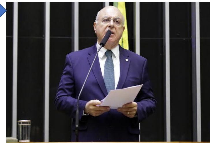
Entrevista para epbr em 19.07.19

Nós precisamos redefinir a institucionalidade do setor elétrico. Há um projeto que foi recentemente relatado pelo ex-deputado Fábio Garcia [PL 1917/2015, da portabilidade da conta de luz] e eu acho que ele está pronto. Acho que recuperar esse projeto seria um passo muito importante para esse momento de reestruturação do setor.