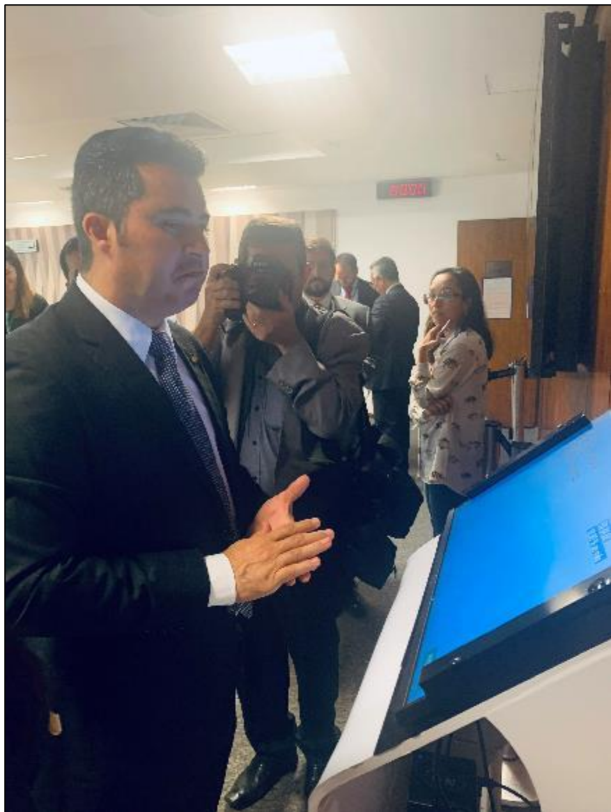
Relator simula quanto economizaria se tivesse direito de escolha