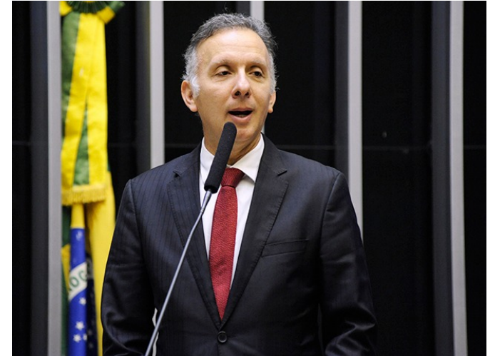
Dep. Aguinaldo Ribeiro PP-PB

“Para cumprir essa tarefa, reunimos, com o apoio dos Presidentes das duas Casas do Congresso Nacional, cinquenta parlamentares da Câmara dos Deputados e do Senado Federal para, no prazo de 45 dias, produzir uma proposta que una e congrege as diversas forças políticas ao redor de um texto positivo e viável.”