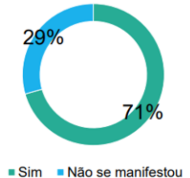
Falta de detalhamento dos cálculos e metodologias financeiras

A maioria das contribuições concorda com a aplicação de penalidades, mas apontam preocupações para que sejam clara e objetivamente identificáveis, definidas pela Aneel